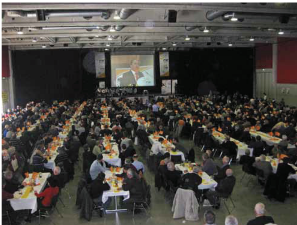
1000 begeisterte Zuschauer sorgten beim Politischen Aschermittwoch in der Deggendorfer Stadthalle für einen neuen Besucherrekord.

Der FW-Landesvorsitzende erklärte, mit dem Brechen der absoluten Mehrheit der CSU im Bayerischen Landtag sei den FW ein wich-