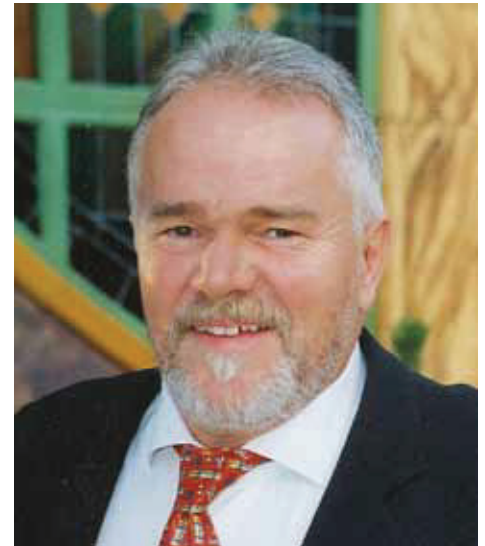
von Dipl.-Ing. Ralf F. Stock, Hallbergmoos